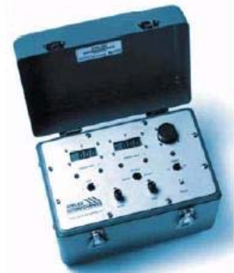
Model 591 Motor Control Unit