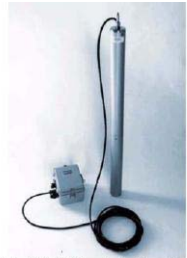
Model 510 Geodetic Borehole Tiltmeter

Control de nivelación remota. El mecanismo de control de nivelación remota en el Modelo 510 permite un posicionamiento estable a los sensores del inclinómetro dentro del rango cero a un microrradián. Sensores en ceros guardan la salida el clinómetro en su escala en un muy alto provecho. La nivelación está controlada por la unidad de Motor-Control del modelo 591 que indica las salidas de inclinación en ejes X y Y, operan dos motores de corriente directa dentro del clinómetro. Cada motor activa un engrane de gusano y una leva ensambladas que ajustan independientemente un sensor y entonces lentamente lo mantiene en la posición deseada. Para ajustar los sensores de inclinación simplemente presione la unidad del motor de control dentro de la caja del clinómetro, luego opere los interruptores en el panel de control.