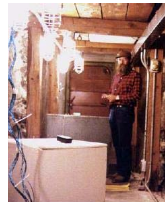
Underground tiltmeter testing vault

Conexiones a fuentes de poder externas y registradores se hacen por vía de una terminal de listón de alta confiabilidad de 10 posiciones. El clinómetro, cable y caja de interruptor está sellada durante toda la operación en ambientes húmedos. Lo último en calidad e inigualable desempeño coloca este clinómetro de plataforma geodésico, modelo 520, en el más sensitivo producto de clinómetros del mundo hoy en día. Sus componentes de bajo ruido se usan durante todas las prácticas y pruebas del modelo 520, no sólo es sensitivo, está plenamente probado y de simple uso. Cada sistema consiste del clinómetro, una caja de interruptor robusta y 3m de cable de interconexión. La nivelación y calibración del usuario del clinómetro se realizan con un micrómetro ó patas de engrane de gusano. Tres diferentes factores de escala y dos filtros de paso lento se usan para se utilizan selectivamente con interruptores de la caja de interruptor.