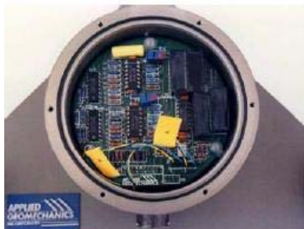
Low-noise components are used throughout

El modelo 520 el vector vertical gravitacional como referencia de su estabilidad. Sus sensores de inclinación electrolíticos miden rotaciones en dos planes verticales ortogonales. Los sensores se pueden describir como espíritus de nivel electrónicos cada uno conteniendo una burbuja en un líquido conductivo. En cuanto el instrumento se inclina, los electrodos de platino en los sensores de pared se mueven dentro o fuera de la burbuja y el área se cobre por los cambios del líquido. Estos efectos cambian la resistencia eléctrica entre los electrodos opuestos de tal forma que el sensor se comporta como un separador de precisión de voltaje capaz de detectar los más pequeños movimientos rotacionales. De ensamble manual y usos de alta calidad, componentes de bajo ruido dan por resultado una sensibilidad, estabilidad y de rango dinámico incomparable.